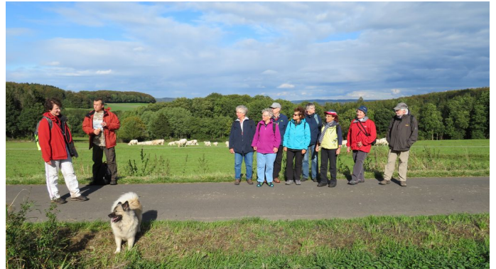
Gruppe auf dem Knüllköpfchen, Foto: Martina Schäfer

Am 2. Oktober sammelte sich die Gruppe wegen dem Lullusfest am tegut-Parkplatz, der wegen eines Flohmarktes unerwartet voll war. Wir fuhren durch den Geisgrund auf das Knüllköpfchen und kehrten in das Bogler-Haus ein. Dieses platzte, auch wegen zahlreicher Hausgäste (Chöre), aus allen Nähten, so dass wir etwas länger auf das Mittagessen warten mussten. Ohne Reservierung hätten wir heute keine Chance gehabt. Aber es schmeckte wie immer prima.