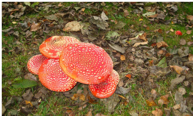
Fliegenpilz nahe der Hohen Luft, Foto: Klaus-Dieter Malkomes