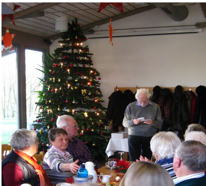
Feier im Klosterbrunnen

Knapp 50 Mitglieder wurden durch unseren 2. Vorsitzenden Lutz Stephan zum Jahresabschluß, im Klosterbrunnen am Petersberg begrüßt.