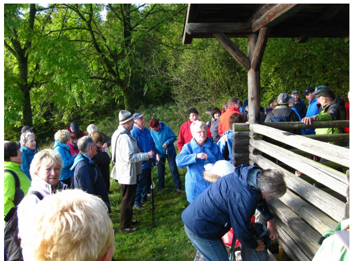
Hütte oberhalb des Feriendorfes

Die örtliche Presse berichtete bereits am 24.10. ausführlich über dieses Ereignis. Am 23.10. versammelten sich ca. 250 Wanderer um an der Erstbegehung des neuen „Eisenberg Panoramaweges“ teil-zunehmen. Nach der Begrüßung durch die Veranstalter wurden 5 Wandergruppen gebildet. Wir und die Wanderfreunde aus Gerterode und Hattenbach wanderten bei der 11 km langen Rundwanderung mit. Zu Beginn drückte noch die Sonne durch die Nebeldecke und ließ dabei den Wald in mystischem Licht erscheinen.