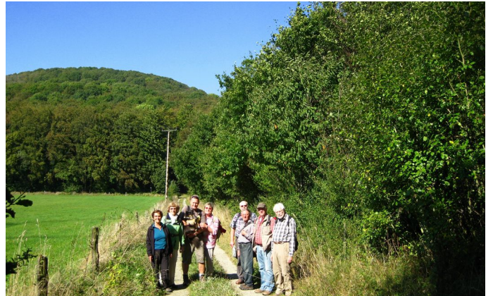
Gruppe im Hess. Kegelspiel

Am letzten Septembersonntag brachen neun Wanderfreundinnen und -freunde und Hund Billy vom Parkplatz Rückersberg aus zu einer Wanderung ins Hessische Kegelspiel auf. Bei schönstem Sonnenschein und angenehmen 20 Grad führte die 14 km lange Tour durch herrlichen Mischwald.