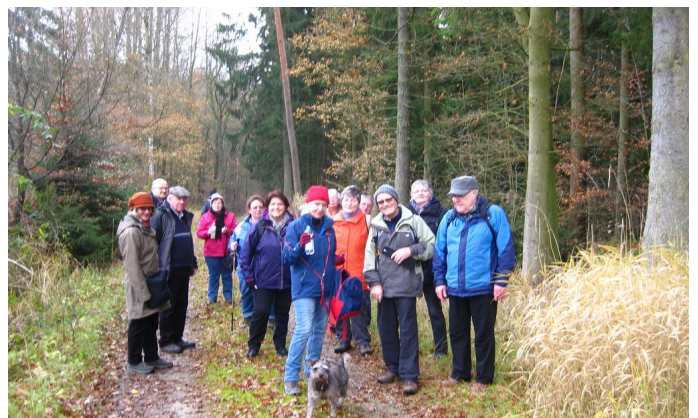
Waldweg am Gr. Mittelberg, Foto: Klaus-Dieter Malkomes

Am 1. Advent starteten wir in Burghaun mit einer 19-köpfigen Wandergruppe. Ein Teil des historischen Ortskern fand unser Interesse. Danach „strebten“ wir entlang des Dimbachgraben, vorbei an der Wüstung Happertshof, hinauf bis kurz vor die Herbertshöfe.