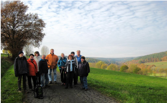
Auf dem Grenzberg

Am Volkstrauertag wanderten wir von Asbach aus, wie auch schon in den Jahren zuvor, zur Gedenkstätte Pfaffenwald bei Beiershausen, um an der dortigen Gedenkfeier teil zu nehmen. Beim Start schlossen sich uns noch einige Mitglieder des Obst- und Gartenbauvereins Asbach zum mitwandern an.